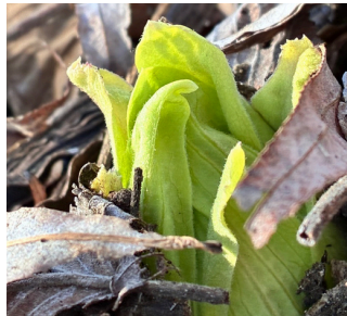
季節のおにぎり ふきのとう味噌 ¥170