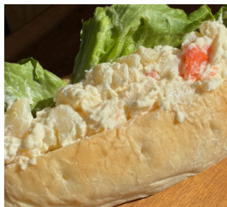
サンドイッチ ポテサラ ¥250