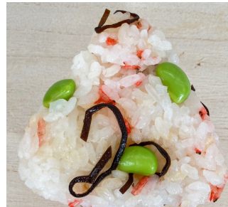
やみつきおにぎり 桜えび・天かす 枝豆・塩昆布 ¥170