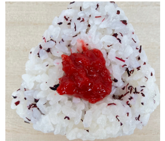
梅おにぎり うめとゆかり ¥170