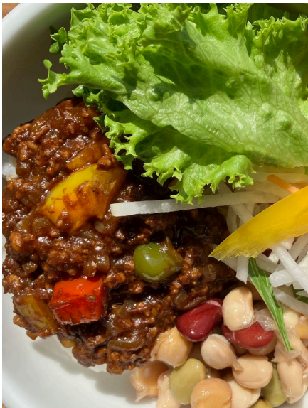
ヒルズキッチン オリジナルカレー ¥700