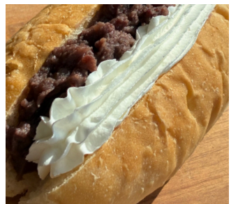
サンドイッチ あずきとホイップ ¥250