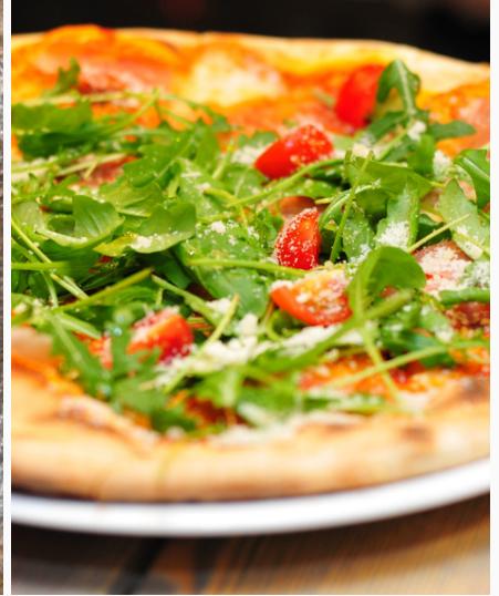
季節のピザ ¥800 (税込)