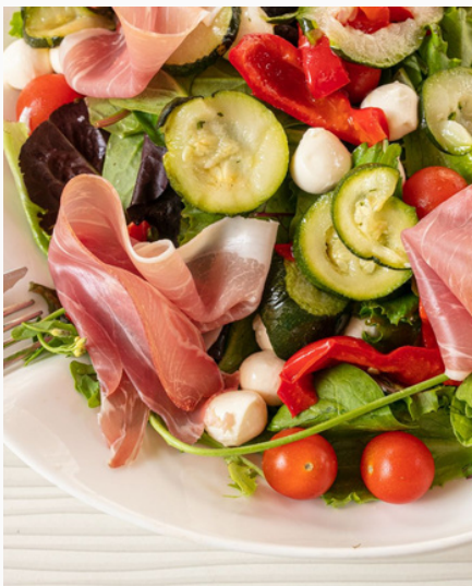
マンガリツツァ豚 サラダボウル ¥950 (税込)