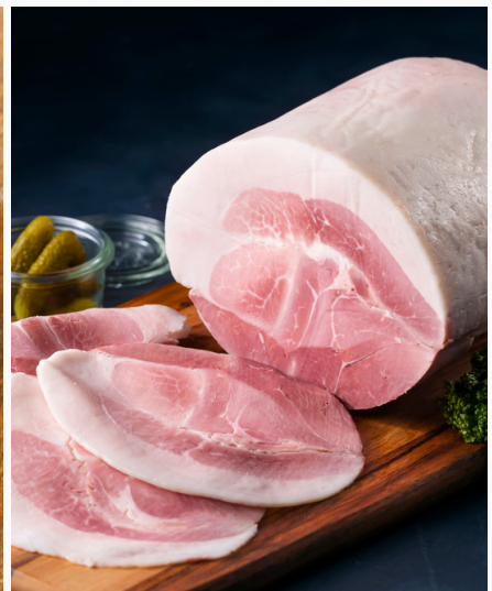
国宝を食べる 贅沢な瞬間を

お試しにまずはこちらをフランスパンにロースハムのみ信頼できる味だからこそシンプルに