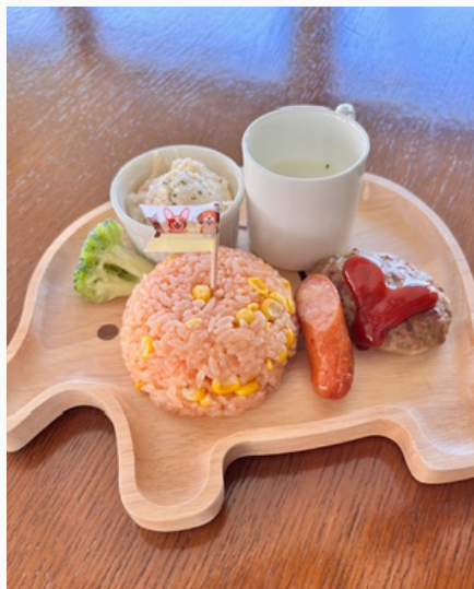
どうぶつプレートの お子様ランチ ¥500 (税込)