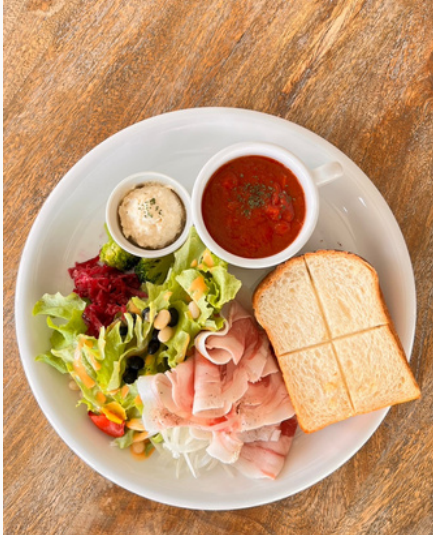
マンガリツツァ豚 ランチプレート ¥1,800 (税込)

マンガリツツァ豚の美味しさをそのまま味わえるランチプレート トカトカさんのイギリスパンと合わせて食べるとよりおいしい