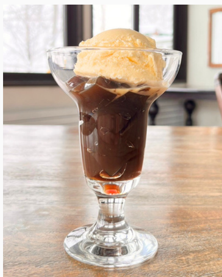
バナラアイスと食べる コーヒーゼリー ¥500 (税込)