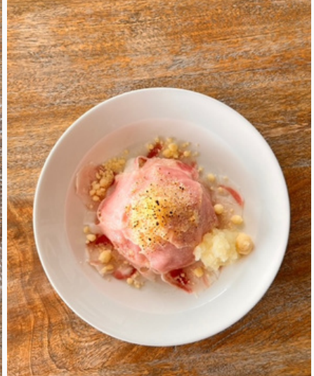
NIWAKARA豚丼 ¥1,500 (税込)

クリスピータイプのピザ生地にとろけるようなロースハムとシャキシャキ食感の野菜が楽しめる