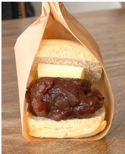
あんばた スコーン ¥300 (税込)