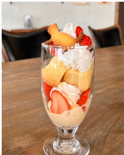
グラス シフォンケーキ ¥650 (税込)