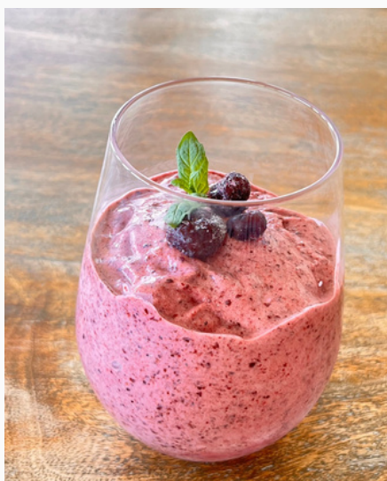
フローズン ブルーベリー ¥500 (税込)

NIWAKARAオリジナル ゼリー入りのクリームソーダ カラーは季節によって変わります