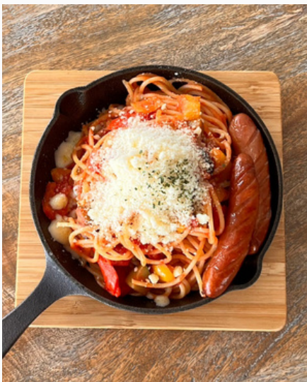
スキレット ナポリタン ¥850 (税込)