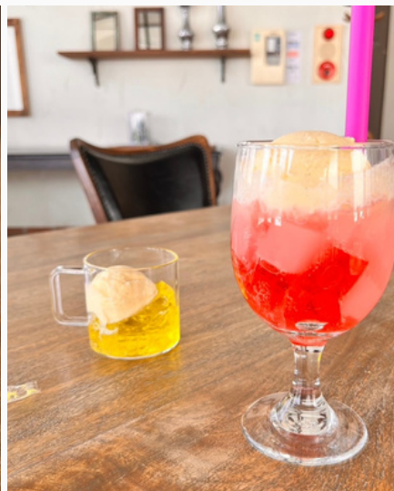
NIWAKARA クリームソーダー ¥500 (税込)

NIWAKARAオリジナル ゼリー入りのクリームソーダ カラーは季節によって変わります