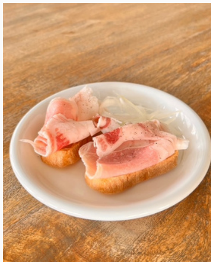
マンガリツツァ豚 カナッペ ¥500 (税込)

お試しにまずはこちらをフランスパンにロースハムのみ信頼できる味だからこそシンプルに