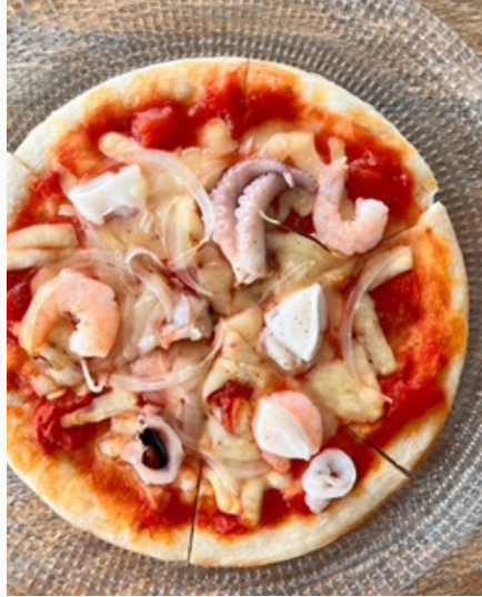
シーフード トマトピザ ¥800 (税込)