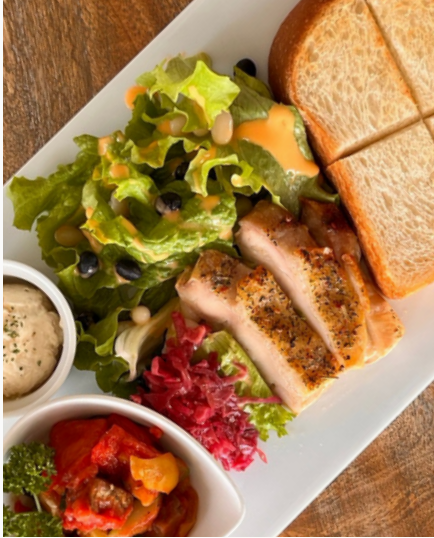
NIWAKARA ランチプレート ¥1,300 (税込)